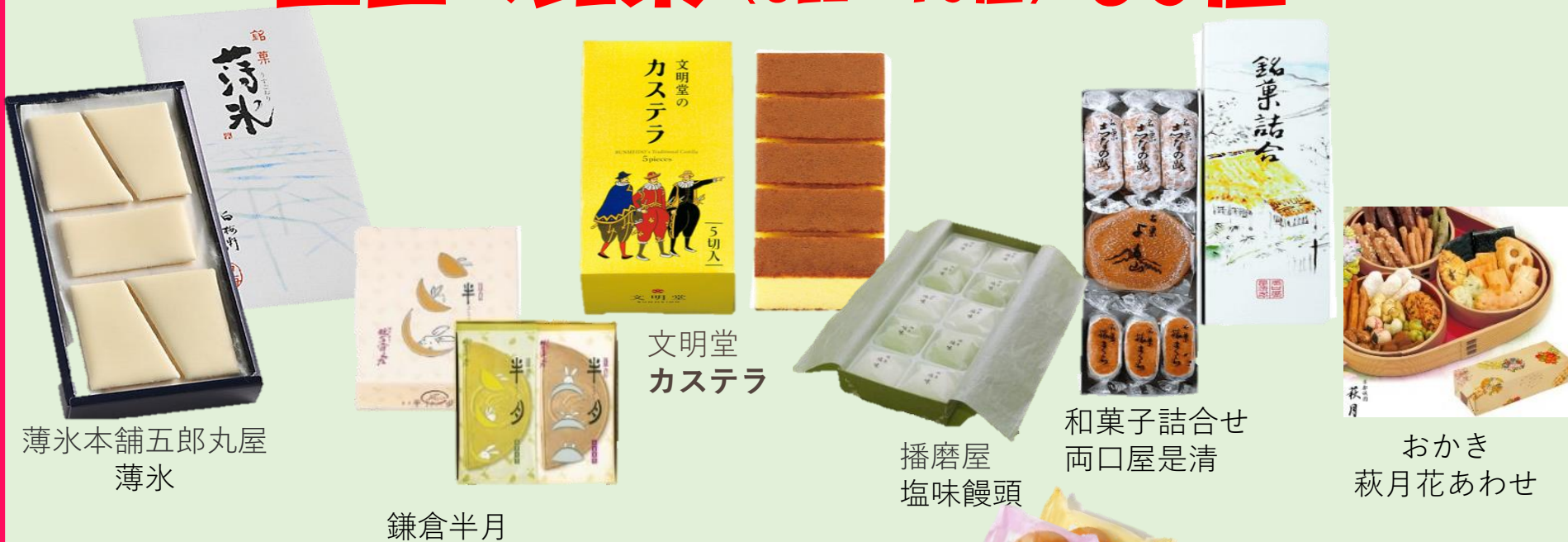
薄氷本舗五郎丸屋 薄氷